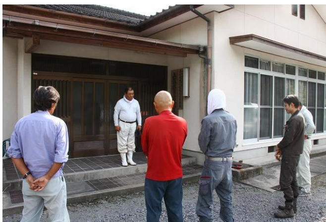
上深水自治区 諫山自治委員よりお礼の挨拶