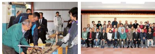
会場：大入島地区公民館