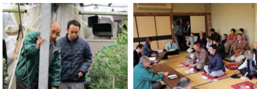
会場：名護屋地区公民館