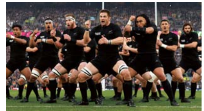
(ニュージーランド ハカ)