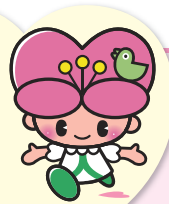
大分県人権啓発 イメージキャラクター こころちゃん