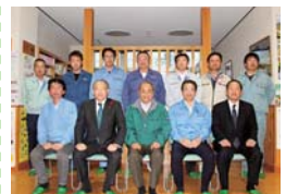
会場：東地区公民館