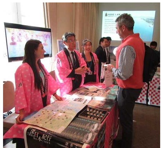
【↑ 去年11月在英国伦敦进行宣传活动的】