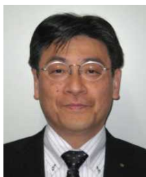
企划振兴部长 広瀬 祐宏 (Yuhiro HIROSE)