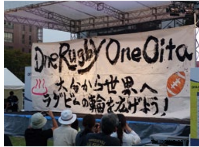
「大分ラグビーファンゾーン2017」での高校生の作品