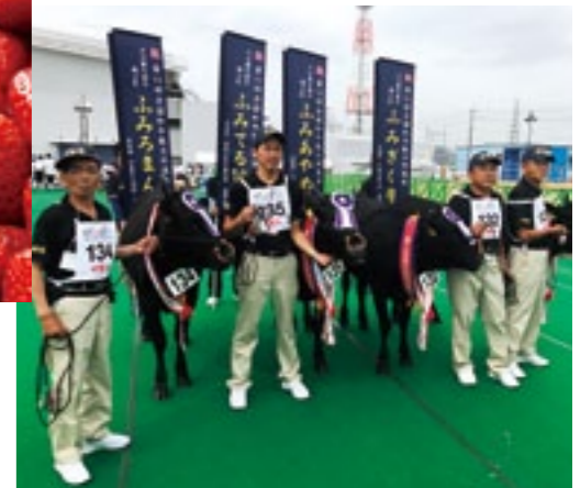
「第11回全国和牛能力共進会」