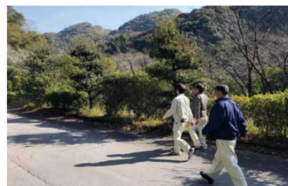
みんな楽しくウォーキング

ご家族の方も一緒にイベントに参加していただいています。家族ぐるみで健康のことを考え、気楽に運動に親しみ、運動の習慣化の契機になるよう努めています。