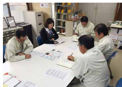
社員みんなで健康情報の共有

体重計、血圧計を社内に常備し、毎日自分の健康状態を把握し、成果を確認できるようにしています。