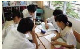
課題解決型の授業(別府市立北部中学校)