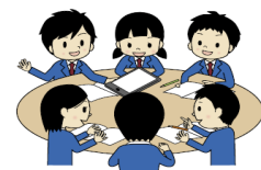
安心して学べる「学びに向かう学習集団」