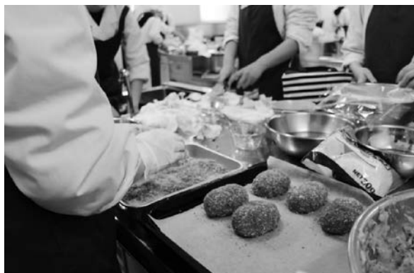
秋「エコ食ライフ」～エコ・クッキング