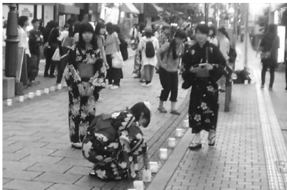
大分県立芸術文化短期大学地域活動室（大分市）

佐伯市では、おおいたうつくし推進隊である佐伯商工会議所女性会と花てまりの会が協働してキャンドルナイトを実施したり、大分市では大分県立芸術文化短期大学地域活動室が府内五番街商店街をキャンドルで彩るなど、県下各地で特色ある取組が展開された。