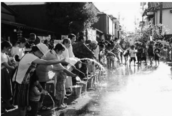
夏「エコ涼ライフ」～打ち水（臼杵市）