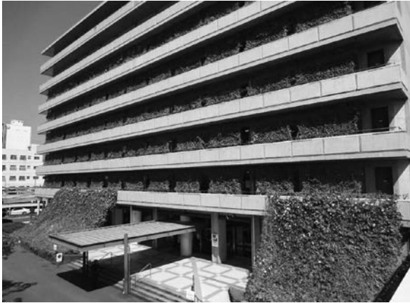
春「エコ花ライフ」～緑のカーテン（大分市）