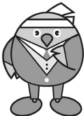
冬「エコ暖ライフ」～重ね着