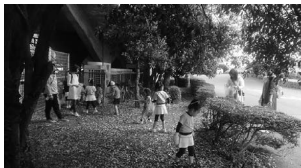
県民一斉おおいたうつくし大行動（大分市）