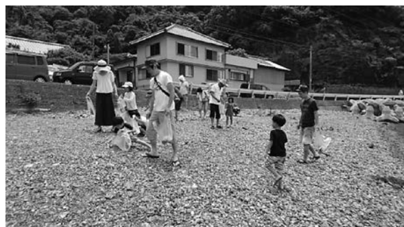
県民一斉おおいたうつくし大行動（臼杵市）

また、10月の最終週を中心に「秋の県民一斉おおいたうつくし大行動」として県民総参加での取組を呼びかけている。