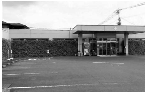
緑のカーテン応募写真（医療法人秋水堂 若宮病院）