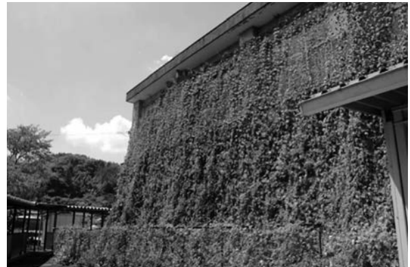
緑のカーテン応募写真（中津市立山移小学校）

また、「緑のカーテンフォトコンテスト」を実施し、平成29年度は家庭、学校、事業所から、60点の応募があり、最優秀賞1点、部門賞5点、特別賞10点を選出した。