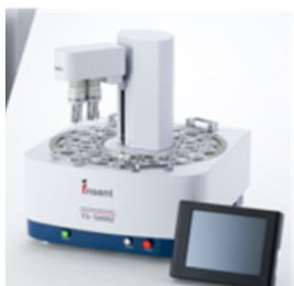
味覚センサー (味のものさし)