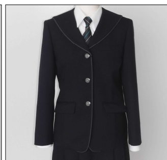
(女子)セーラージャケットタイプ