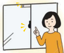
玄関や全ての部屋の窓を確実に施錠する(内鍵、チェーンロック、補助鍵がある場合は、その活用を含む)

発熱から少なくとも2日間は、就寝中を含め、特に小児・未成年者が容易に住居外へ飛び出さないために、例えば、以下のような具体的な対策を講じるよう、保護者の方にご説明ください。