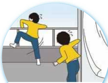
興奮して窓を開けてベランダに出て、飛び降りようとする