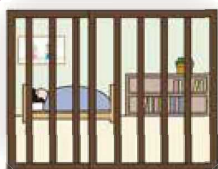
窓に格子のある部屋がある場合は、その部屋で寝かせる