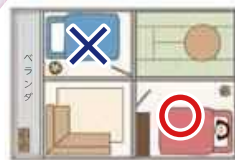
ベランダに面していない部屋で寝かせる