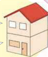
一戸建てにお住まいの場合は、できる限り1階で寝かせる