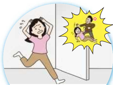
人に襲われる感覚を覚え、外に走り出す