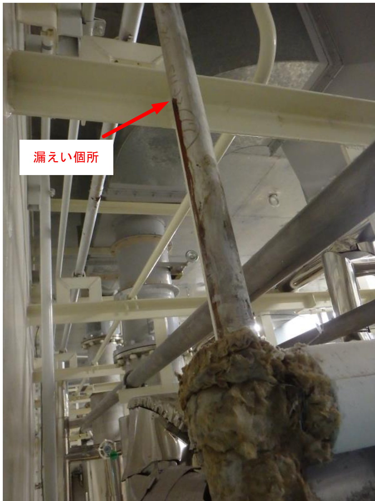
3号機 洗濯設備補助蒸気配管 現地状況（保温取り外し後）