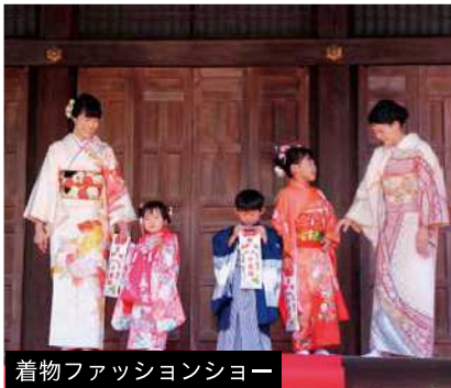
着物ファッションショー