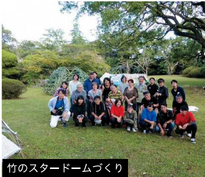
竹のスタードームづくり