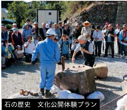
石の歴史 文化公開体験プラン