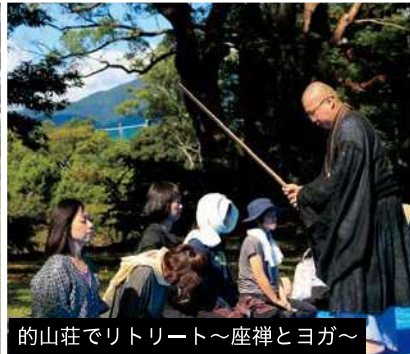
的山荘でリトリート～座禅とヨガ～