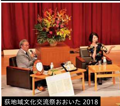
荻地域文化交流祭おおいた 2018