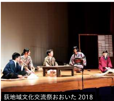
荻地域文化交流祭おおいた 2018