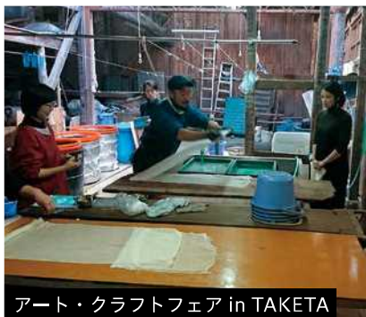
アート・クラフトフェア in TAKETA