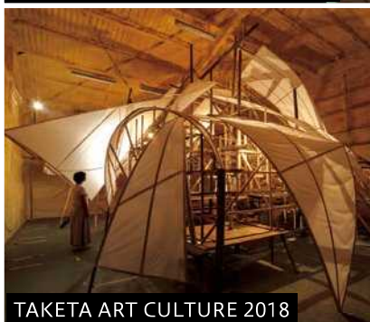
TAKETA ART CULTURE 2018