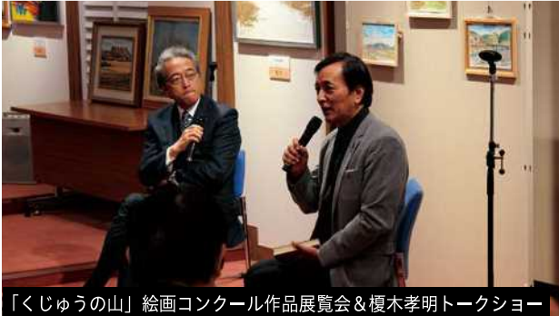
「くじゅうの山」絵画コンクール作品展覧会&amp;榎木孝明トークショー