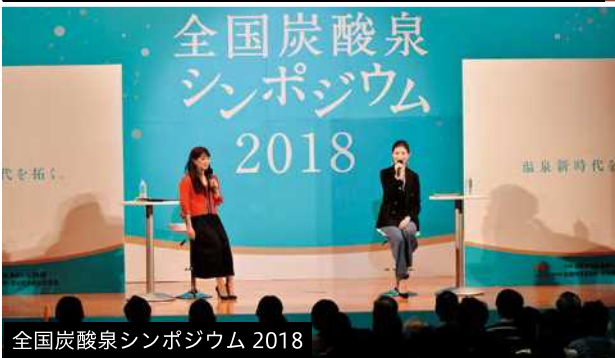
全国炭酸泉シンポジウム 2018