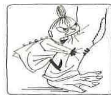
1 トーベ・ヤンソン『ムーミン谷の冬』挿絵 1957年頃 インク・紙 2 トーベ・ヤンソン『イースターカード原画』1950年代 グワッシュ、インク・紙 3 トーベ・ヤンソン『スウェーデンの日報『スヴェンスカ・ダグブラデット』広告』1957年印刷 4 トーベ・ヤンソン、ラルス・ヤンソン『環境保全キャンペーンのポスター』1970年代印刷 5 トーベ・ヤンソン『フォレンジングス銀行』広告 1956年印刷 6 トーベ・ヤンソン『小さなトロールと大きな洪水』挿絵 1945年 インク、鉛筆・紙 7 トーベ・ヤンソン『ムーミン谷の群像』挿絵 1946年、1968年(改作) インク・紙 8 トーベ・ヤンソン『ムーミン谷の夏まつり』挿絵 1954年 インク・紙 1~5はムーミンキャラクターズ社蔵、6~8はムーミン美術館蔵 © Moomin Characters™