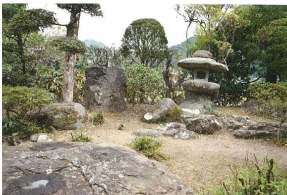
庭園内から名勝耶馬溪の景観を望むことができる