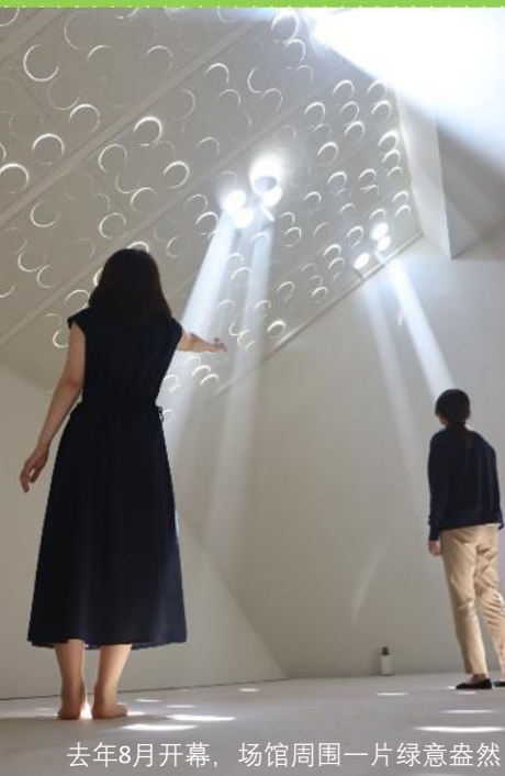
去年8月开幕，场馆周围一片绿意盎然