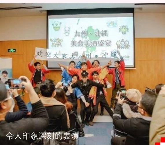
令人印象深刻的表演

另外，在各县的乡土料理、小吃和酒类等的试吃环节，大分县提供了县内著名的炸鸡料理、鸡肉饭以及柚子利口酒。不知能否带给到场的客人们些许仿佛在九州大分县旅行的实感呢？