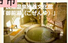
温泉療養文化館 「御前湯(ごぜんゆ)」