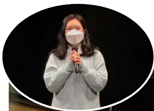
左：ステージ上で挨拶する 県国際交流員 蘆（ノ）さん

当日は検温や消毒、入場制限など必要な感染症対策を講じたうえで実施され、多くの方が日韓の交流に理解を深めました。