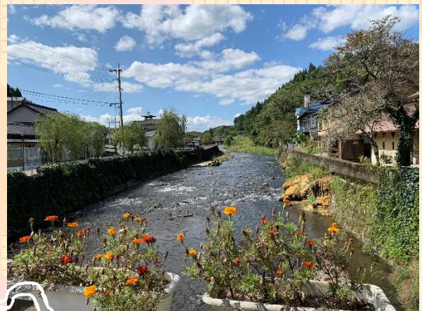
長湯の観光名所「ガニ湯」の周辺

去年の春節から湖北省の武漢市でコロナウイルス感染が爆発して大変な状況になりました。しかし、全国で力を合わせてコロナウイルスと戦って状況が相当に良くなりました。私も一員としてずっと頑張ってきました。全世界ではコロナウイルス感染累計が1億人を超えましたが、各国は協力して絶対コロナウイルスに勝ると信じています。