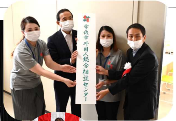
↑ 宇佐市长和 咨询员们