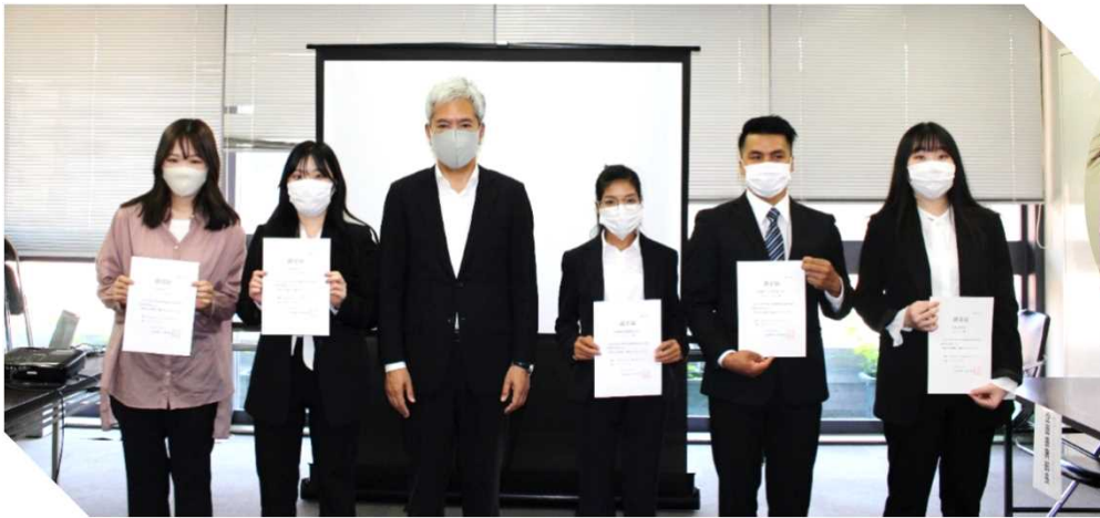
大塚企划振兴部长和各大学的代表一起合影（左数第三位）

6月9日（周三）、在大分县厅举办了大分县自费外国留学生奖学金获得者认证仪式。当天各大学派代表前往县厅直接领取认证证，并通过线上直播的方式，让其他奖学金获得者也能观看仪式，正是新冠疫情下的特殊举办方式。