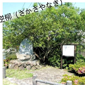
逆柳 (さかさやなぎ)

灯台下方海水腐蚀的溶洞内栖息着一群牡蛎，不浸入水中，传说如果食用会引起腹痛。这种牡蛎长的很像阿弥陀三尊的形状，所以被称作阿弥陀牡蛎。