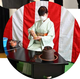
← 开所当天 还举办了 茶道体验！

宇佐市从2019年开始策划制定“宇佐市多文化共生・国际推进计划”。新设多文化共生・交流係这个新的部门，为了实现多文化共生社会、计划将展开多种多样的事业。