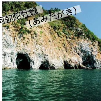
阿弥陀牡蛎 (あみだがき)

灯台下方海水腐蚀的溶洞内栖息着一群牡蛎，不浸入水中，传说如果食用会引起腹痛。这种牡蛎长的很像阿弥陀三尊的形状，所以被称作阿弥陀牡蛎。