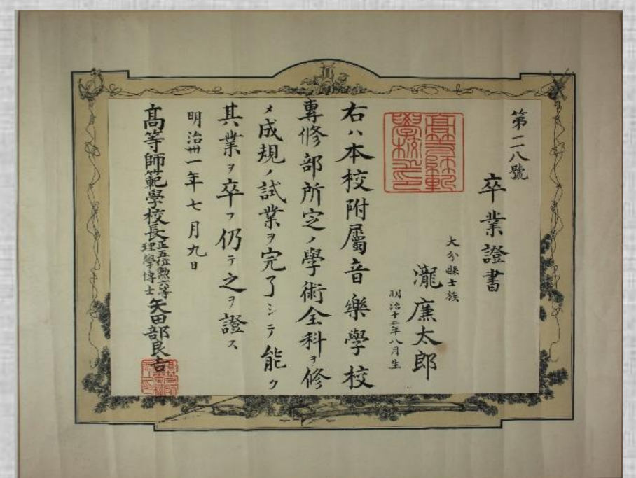
東京音楽学校卒業証書 (当館所蔵)

休館日 6/19(月)、7/3(月)、7/18(火) 7/31(月)、8/7(月)、8/21(月)