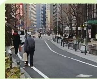
シケイン(スラローム型)