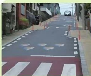
シケイン(クランク型)