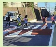
スムーズ横断歩道

路面をなめらかに盛り上げ、30km/h以上の速度で走行する車両の運転者に不快感を与える構造物です。