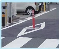
ライジングボラード

ポールを昇降させ、交通規制が実施されている時間帯等の車両の進入を抑制する構造物です。