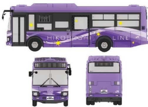
日田彦山線BRTの車両デザイン(あやめカラーver.) ※あやめの花は日田市のシンボル

A 昨年10月に、大肥(おおひ)の郷(さと)まちづくり会議の皆さんが策定した将来ビジョンの実現に向けて、これからが正念場です。県としては、次の3つを念