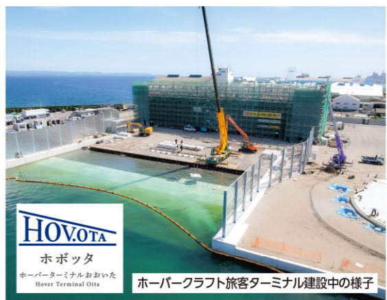
HOVOTA ホボッタ ホーパークラフト旅客ターミナル建設の様子

また、今後の産業構造の転換等を見据え、蓄電池などの新たな産業にも目を向け、多様な案件を幅広く誘致することも大切です。