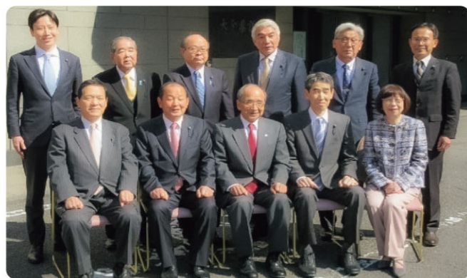
※知事・議長・副議長との記念撮影