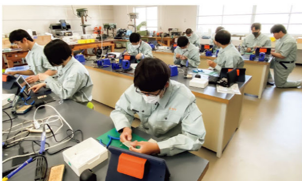
大分工業高校1年電子科の電子回路設計・製作実習の様子

1つ目は、大分ならではの新たな魅力の創出です。大自然を満喫できるコンテンツや、宇宙港、ホーパークラフトなど唯一無二の素材の開発を進めます。2つ目は、観光産業の基盤強化です。業務効率化や発信力、経営基盤の強化など、事業者の取組を支援してまいります。3つ目は、「住んでよし、訪れてよし」の観光・地域づくりです。観光客の満足度向上と住民の満足度や豊かさを高めてまいります。