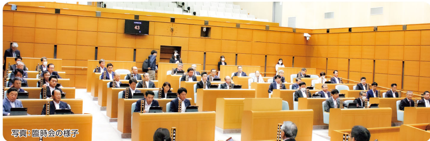
写真: 臨時会の様子