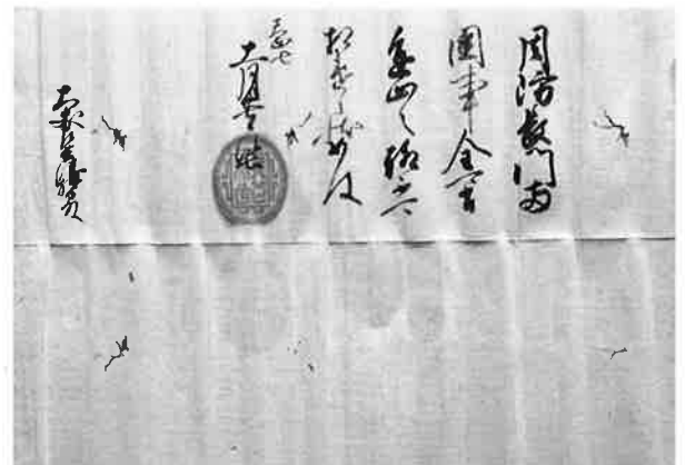
織田信長朱印状(立花家史料館所蔵・柳川古文書館寄託)