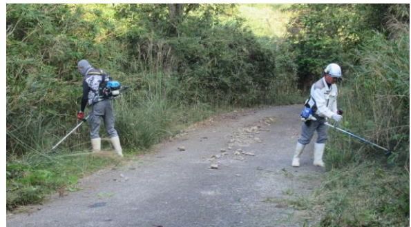
作業中 (滝貞久保畑線)