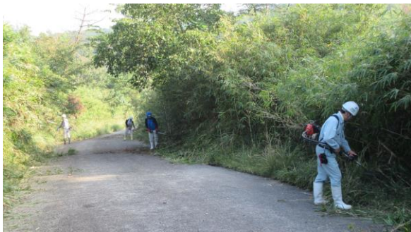
作業中 (滝貞久保畑線)