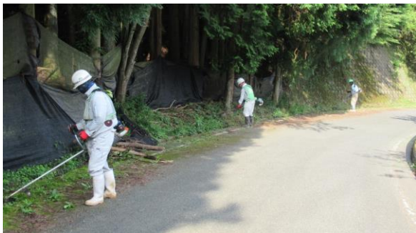
作業中（和田羽馬礼線）