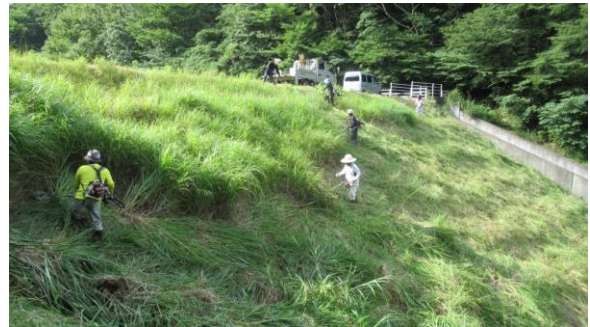
作業中（ため池土手）