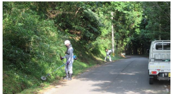
作業中（和田羽馬礼線）