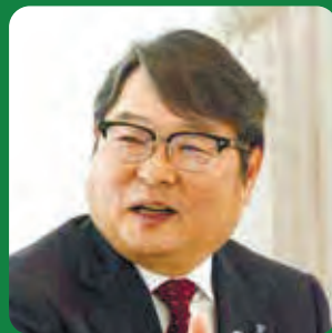
九州電力株式会社 代表取締役 社長執行役員