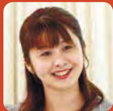
株式会社大分放送 アナウンサー (司会進行)