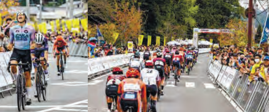
日田市街地を走る選手団