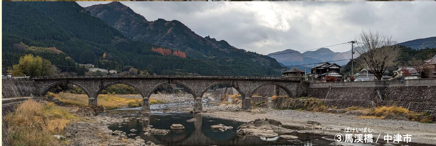
はけいばし ③ 馬溪橋 / 中津市