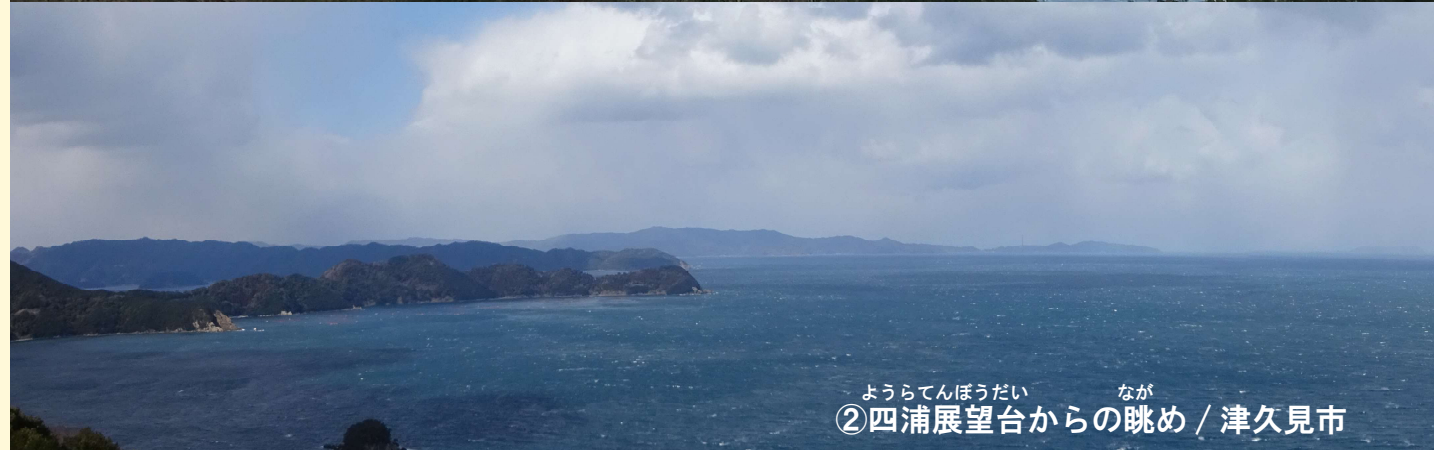
ようらてんぼうだい なが ②四浦展望台からの眺め / 津久見市