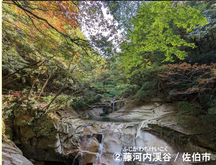
ふじかわちけいこく ②藤河内溪谷 / 佐伯市