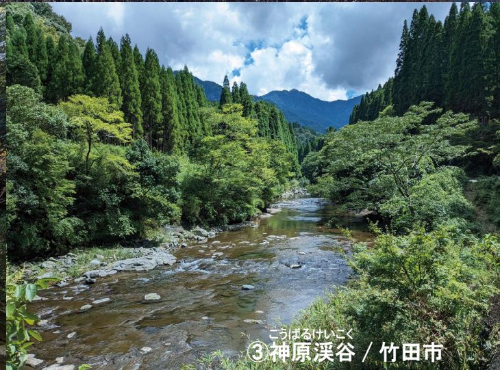
こうばるけいこく ③神原溪谷 / 竹田市