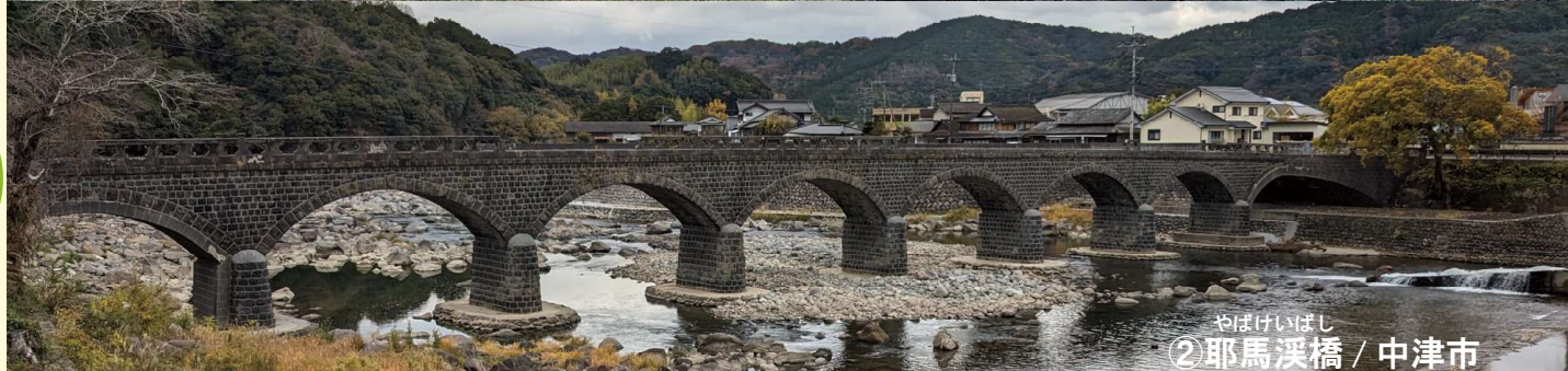
やばけいばし ② 耶馬溪橋 / 中津市