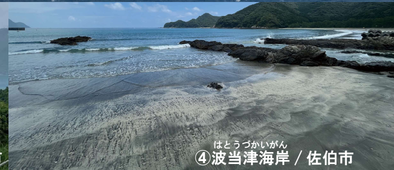
はとうづかいがん ④波当津海岸 / 佐伯市