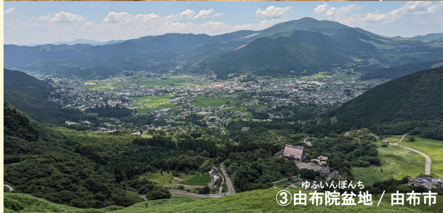
③ゆふいんぼんち / 由布市