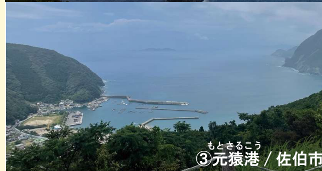
もとさるこう ③元猿港 / 佐伯市