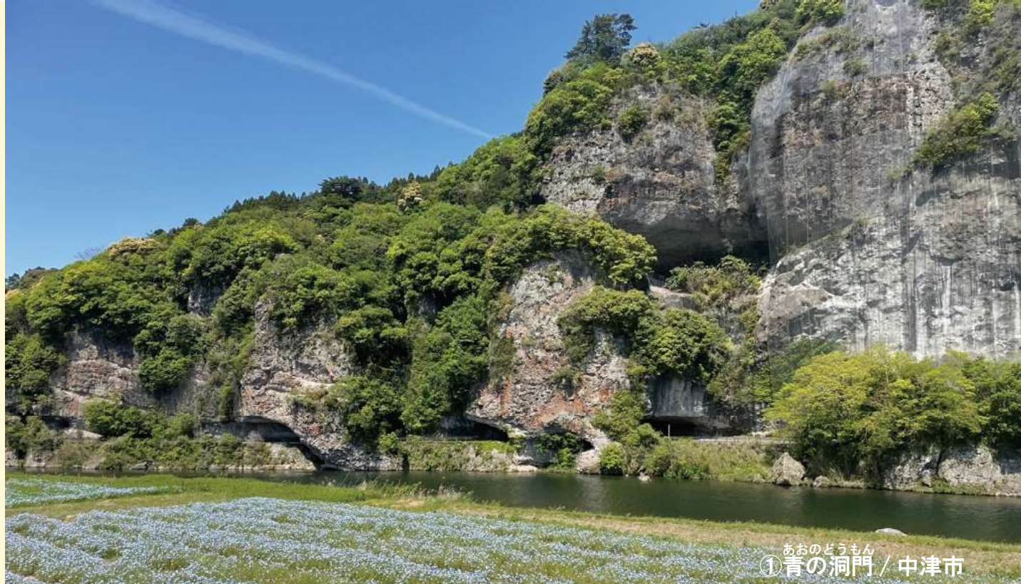
あおのどうもん ① 青の洞門 / 中津市