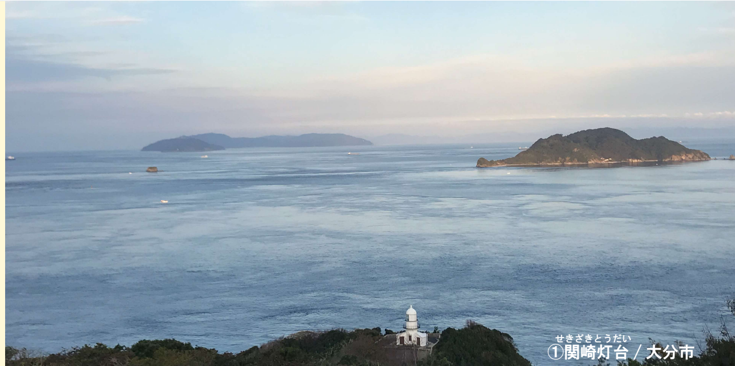
せきざきとうだい ①関崎灯台 / 大分市