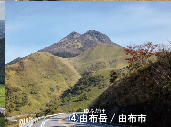
④ゆふだけ / 由布市