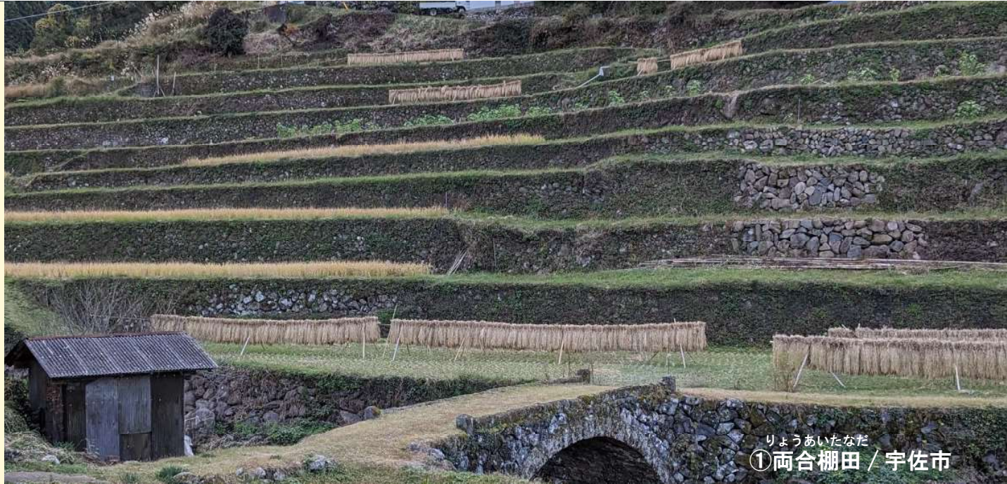
りょうあいたなだ ① 両合棚田 / 宇佐市