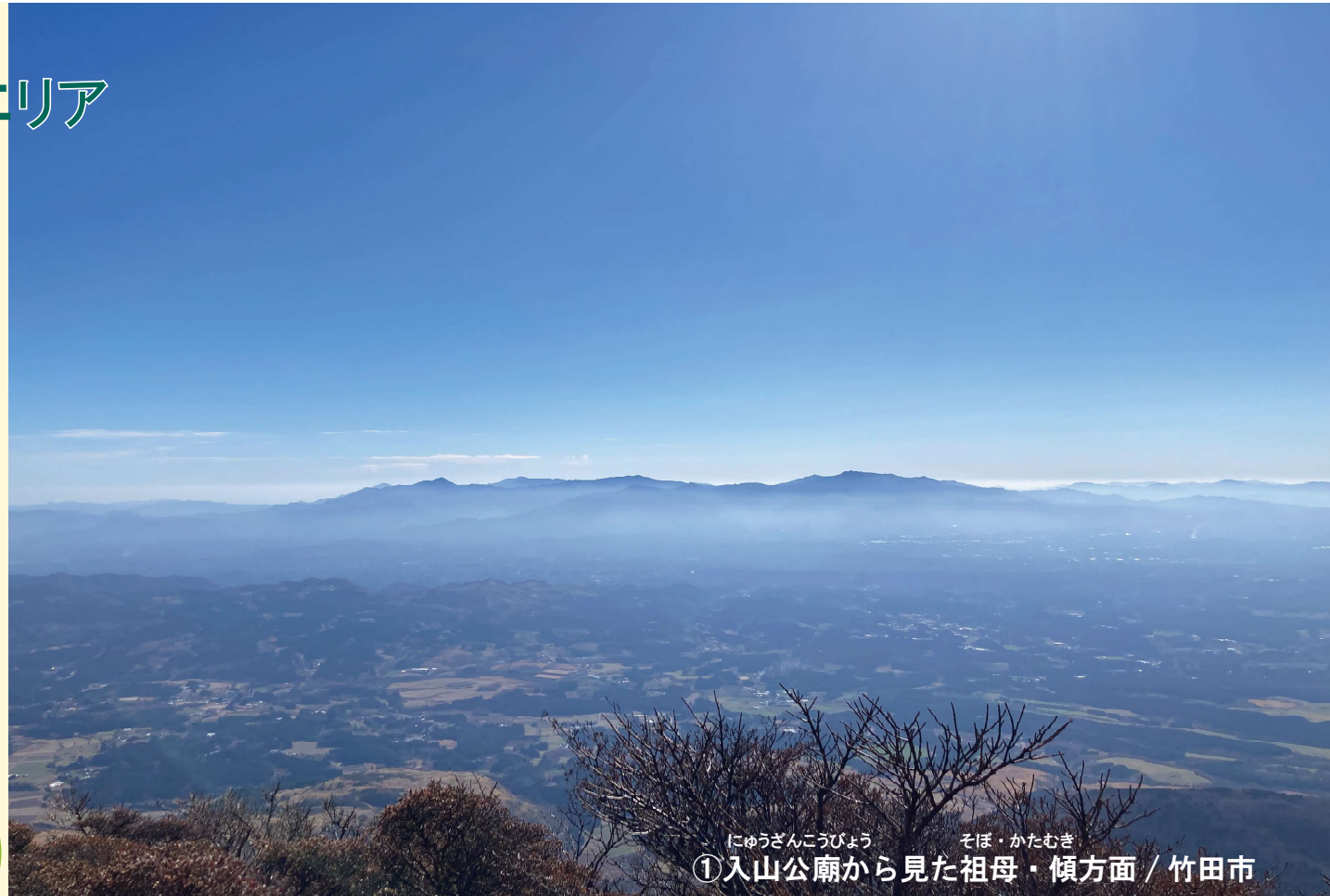
にゅうざんこうびょう そぼ・かたむき ①入山公廟から見た祖母・傾方面 / 竹田市