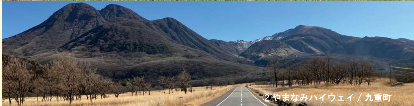
②やまなみハイウェイ / 九重町