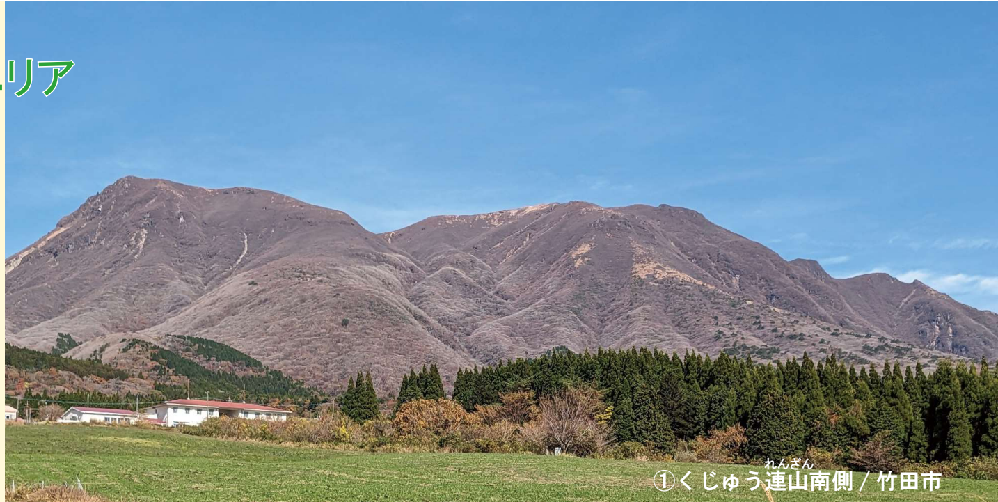
①くじゅう連山 れんざん 南側 / 竹田市