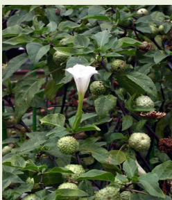
チョウセン アサガオの 葉と花