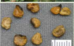
チョウセン アサガオの 種