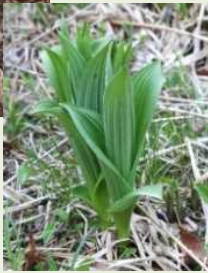
芽出し期 のコバイ ケイソウ