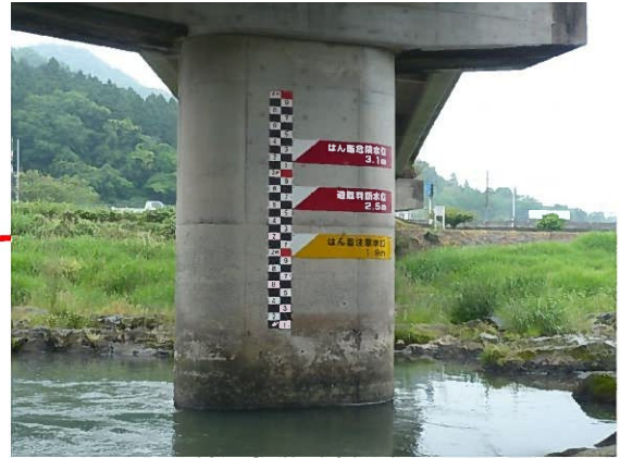
上荘橋(水位計設置箇所)