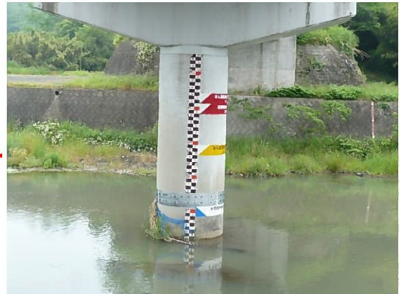
安心院大橋(水位計設置箇所)