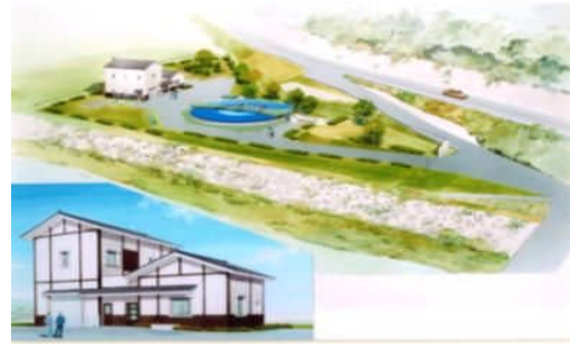
【山国浄化センター(完成予想図)】

終末処理場の能力 670m 3 /日 (面積 56ha、1,460名分の生活排水の処理が可能)