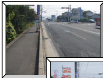
【県道大分臼杵線 大分市牧】