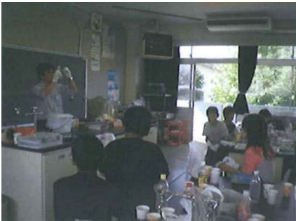
廃食用油を利用した石けん作りワークショップ