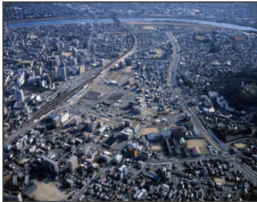
【大分駅周辺整備状況】