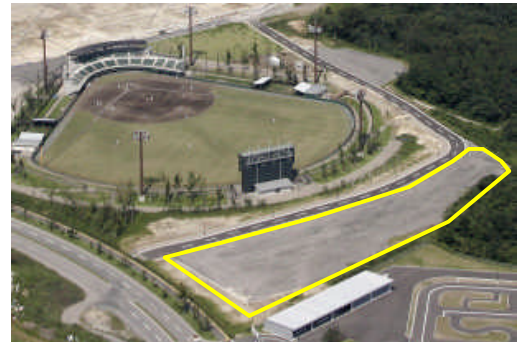
【張替用芝生の育成圃場建設地】