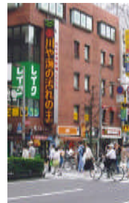
電光掲示板による広報