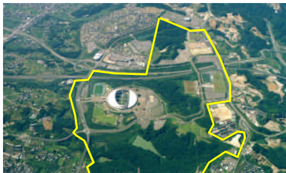
【広大な緑地を保全する大分スポーツ公園】

21年度は、大分スポーツ公園にて、だいきんフィールドの陸上公認検定に向けた施設補修等行うとともに、大分銀行ドームの張替用芝生の育成圃場の整備に着手しました。