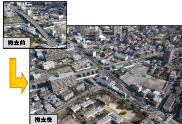
【春日陸橋付近の状況】