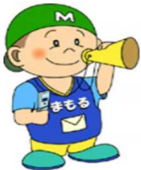
マスコットキャラクター まもるくん