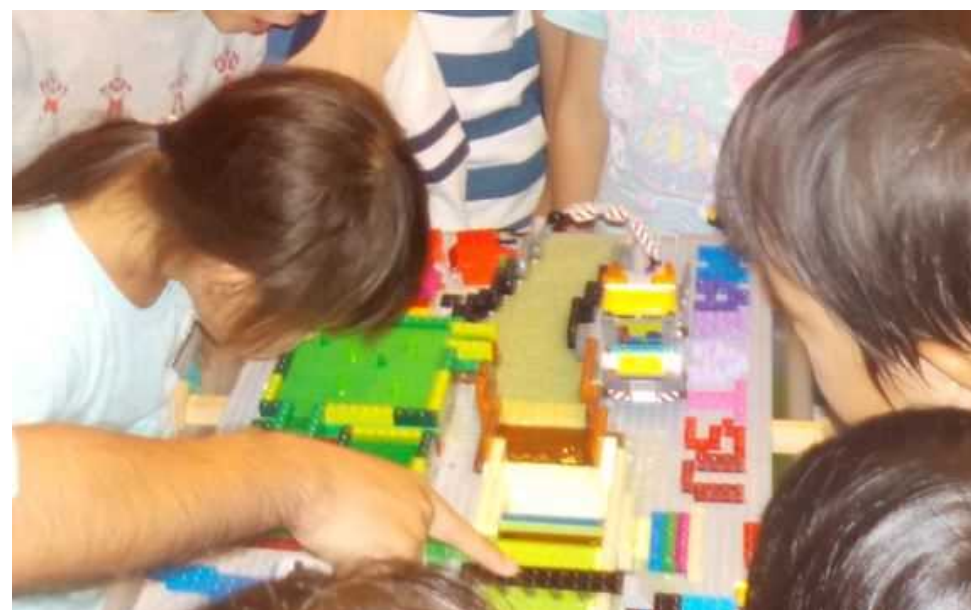
“レゴ”を用いた河川改修状況の模型