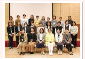
女性農業経営士異業種事例研修