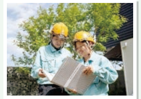
様々な分野で活躍する女性ロールモデルの紹介