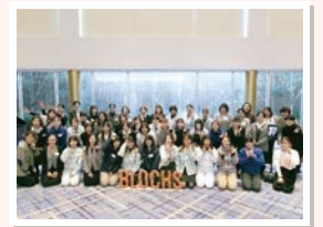
建設業界で働く女性向けのスキルアップセミナー