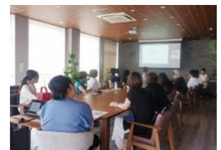
女性起業家の発掘および起業家ネットワークの構築