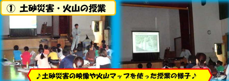
♪土砂災害の映像や火山マップを使った授業の様子♪