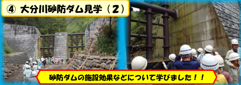
砂防ダムの施設効果などについて学びました！！