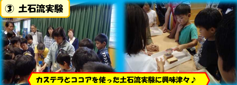
カステラとココアを使った土石流実験に興味津々♪