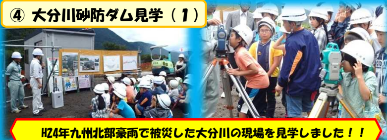
H24年九州北部豪雨で被災した大分川の現場を見学しました！！