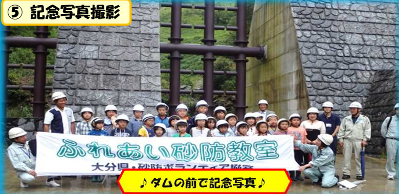
♪ダムの前で記念写真♪