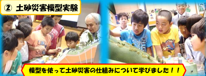
模型を使って土砂災害の仕組みについて学びました！！