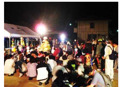
避難所への避難状況