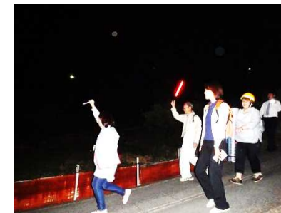
避難所への移動状況