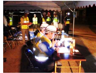
災害対策本部・救護所の設置

ホワイトボードを使った情報共有訓練や負傷者2名をリヤカー及び担架で救護所へ搬送する救出・救護訓練を行い、228名の住民が避難しました。