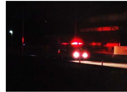
消防・警察車両による避難誘導