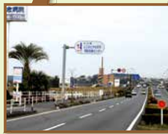
由布市側から来る時