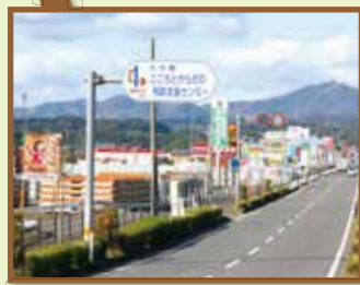
光吉側から来る時