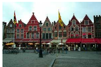
明るい色でもきれいだけどなあ