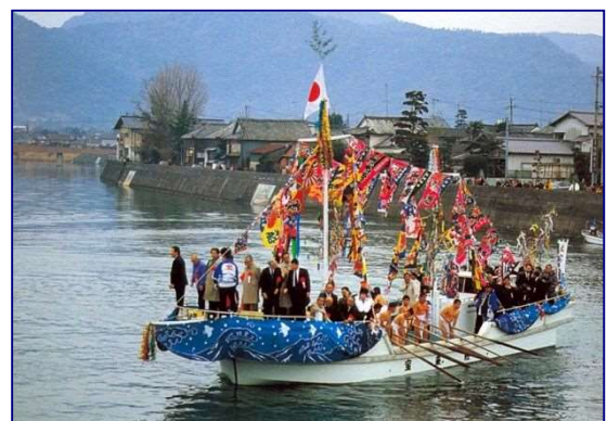
ホーランエンヤ(管絃祭) (高田港海岸 大分県)

産業利用としては、生産・運輸活動の拠点として利用されている北九州港（国際拠点港湾）、苅田港、中津港、別府港、大分港の各重要港湾が位置するとともに、漁業活動の拠点となる漁港も数多く位置している。