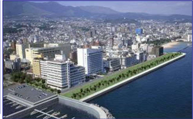
海岸環境整備事業による海岸整備 (別府港海岸北浜地区 大分県)