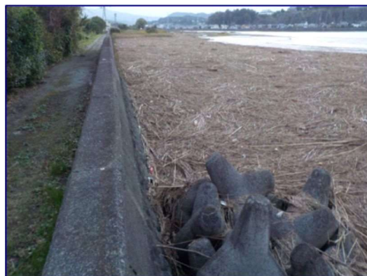
台風後の漂着物(守江港海岸 H26.10.13)

こうした状況の中、海岸漂着物対策の推進を図ることを目的として、「美しく豊かな自然を保