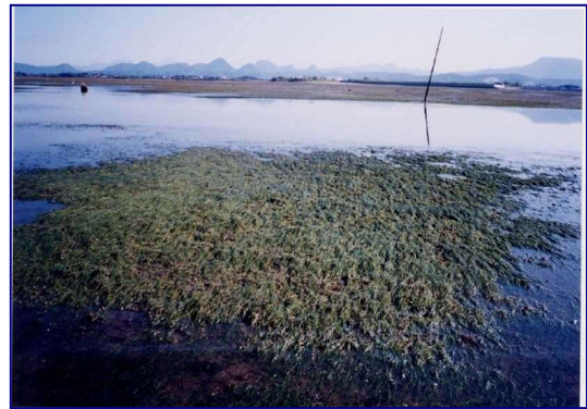
コアマモの植生（中津港海岸 大分県）