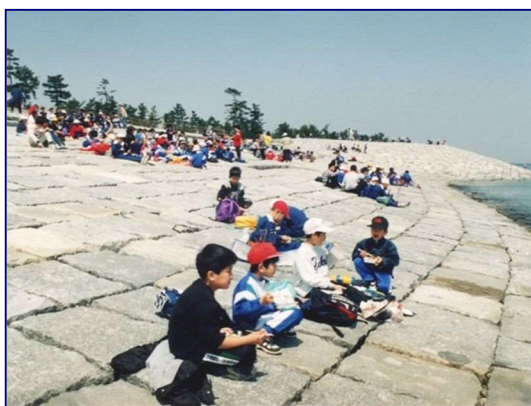
C.C.Zによる海岸整備 (椎田海岸八津田地区 福岡県)

その後、海岸に対する様々なニーズの高まりから、椎田海岸での C.C.Z ※注 2) による整備や脇田漁港海岸等の海岸環境整備等も実施されている。