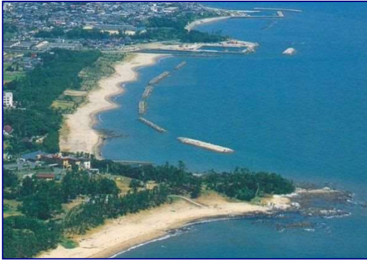
侵食対策事業による海岸整備 (国東海岸小原地区 大分県)

今後、別府港海岸や大分港海岸など一部の区間では高潮に対する海岸保全施設の天端高不足や老朽化等により整備の必要な箇所が残されている。また、新たに L1 津波による天端高が不足する箇所の整備が必要となっている。これらの継続的な整備と新たな津波対策整備が重要な課題となっている。 注4)