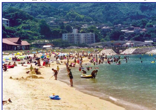
家族連れで賑わう人工海浜 (大分海岸田ノ浦地区 大分県)

潮干狩りについては、周防灘側に面した海岸には干潟が多く存在するため、潮干狩りの場として利用される海岸が多い。また海釣りについては、響灘側をはじめ休日等には多くの釣り客でにぎわう所も多い。