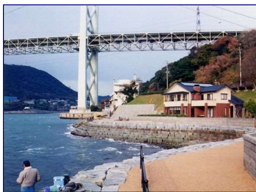
関門海峡の眺望を活かした観潮遊歩道 (北九州港海岸大久保・和布刈地区 福岡県)

さらに、海に係る様々な歴史的・文化的資源として、門司港付近の歴史的建築物や和布刈神社の神事、石塚山古墳、八幡古表神社の傀儡子の舞と相撲、豊前高田市のホーランエンヤや姫島の舟引祭等、様々な歴史的・文化的な行事が継承されている。