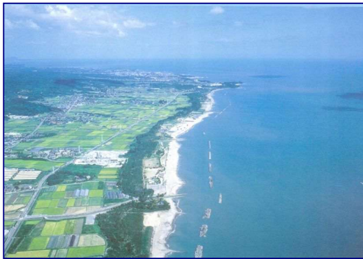
豊かな海岸林と砂浜（国東・武蔵海岸 大分県）