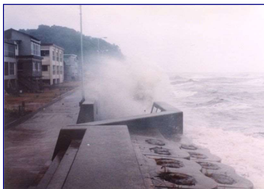
高潮・高波による越波 (行橋海岸長井北地区 福岡県)

また、平成 23 年 3 月 11 日の東日本大震災以降、想定地震動の見直しがされ、今後南海トラフで発生する地震が 30 年以内に発生する確率は 70%程度と予想されており、津波による被害が懸念されている。