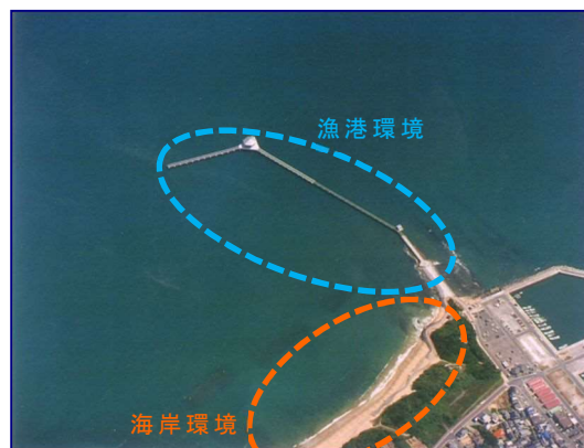
海岸環境整備事業による海岸整備 (脇田漁港海岸 福岡県)

大分県では、キジヤ台風（昭和 25 年）やルース台風（昭和 26 年）による大災害を契機に、宇佐海岸等で高潮対策事業による海岸整備が行われてきた。