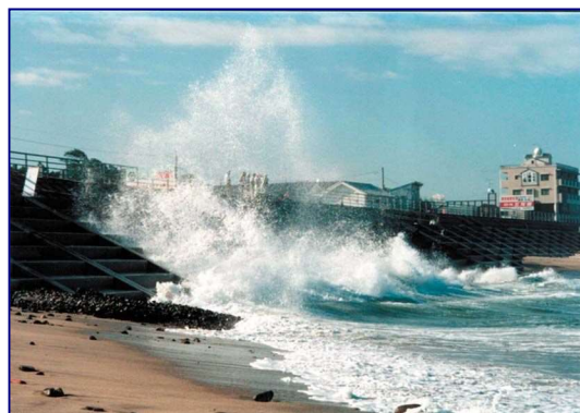
高波による越波(安岐海岸塩屋地区 大分県)