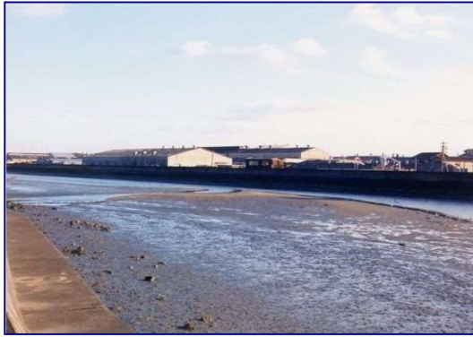
良好な海域環境（福岡県周防灘側の干潟）

自然公園は、福岡県では玄海国定公園、瀬戸内海国立公園、筑豊県立自然公園などが指定され、周防灘側で自然海浜保全地区の指定がなされている。大分県では、姫島、国東半島、高崎山周辺で、瀬戸内海国立公園、国東半島県立自然公園などが指定され、国東半島で自然環境保全地区及び自然海浜保全地区の指定がなされている。