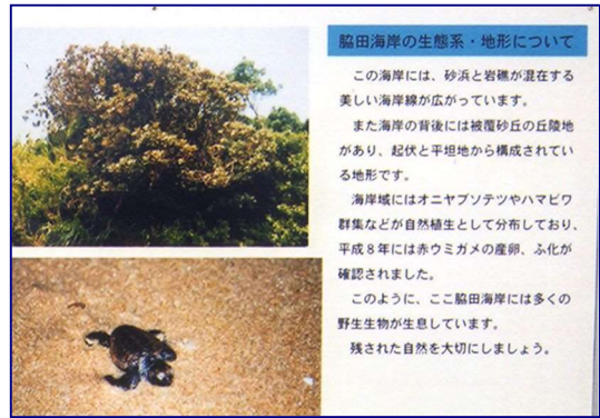
良好な自然環境保全の啓発への取り組み （脇田漁港海岸 福岡県）