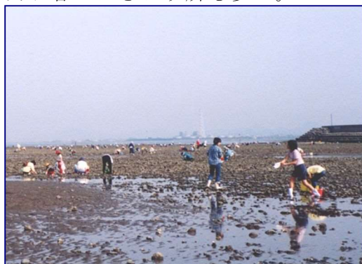
潮干狩りでにぎわう干潟海岸 (福岡県周防灘側)