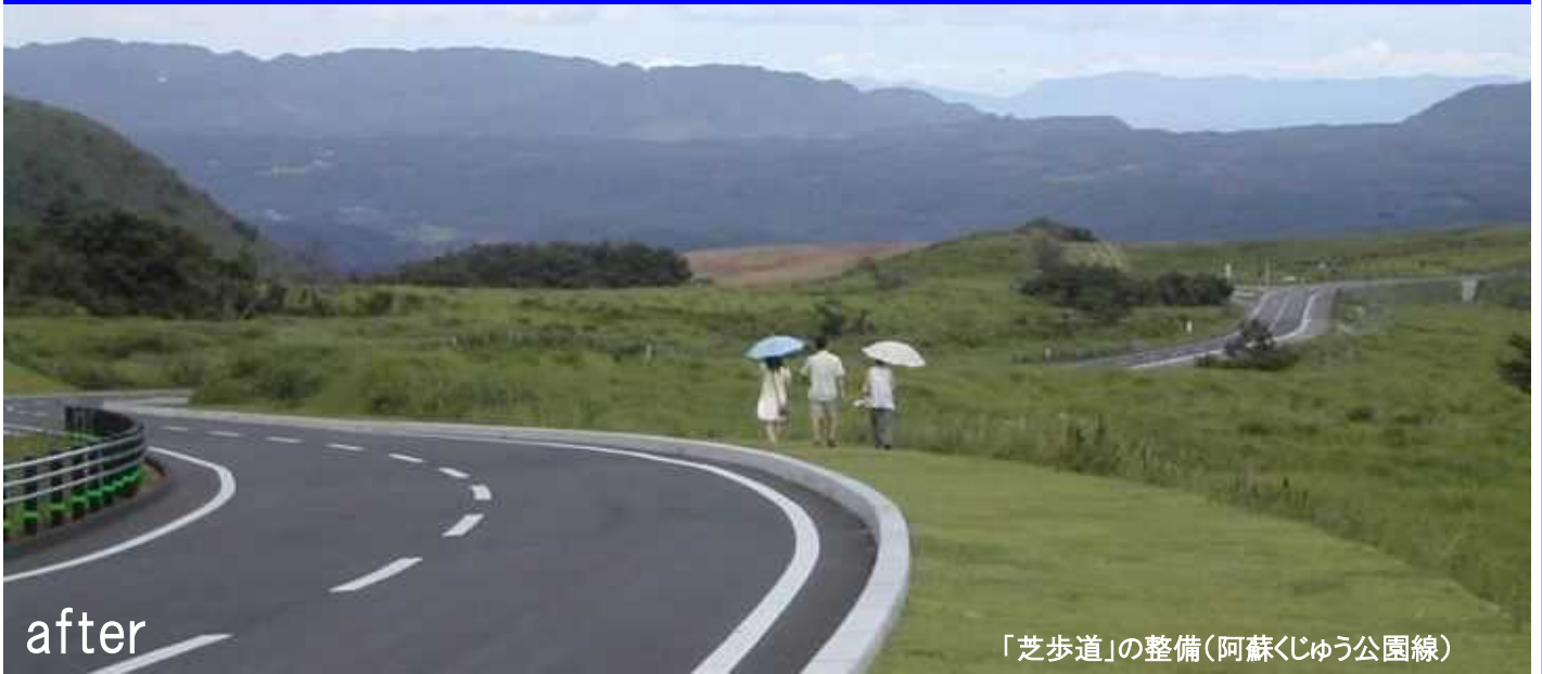
「芝歩道」の整備(阿蘇くじゅう公園線)