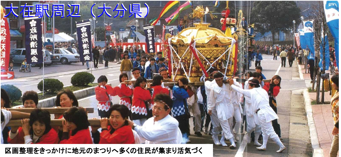
区画整理をきっかけに地元のまつりへ多くの住民が集まり活気づく