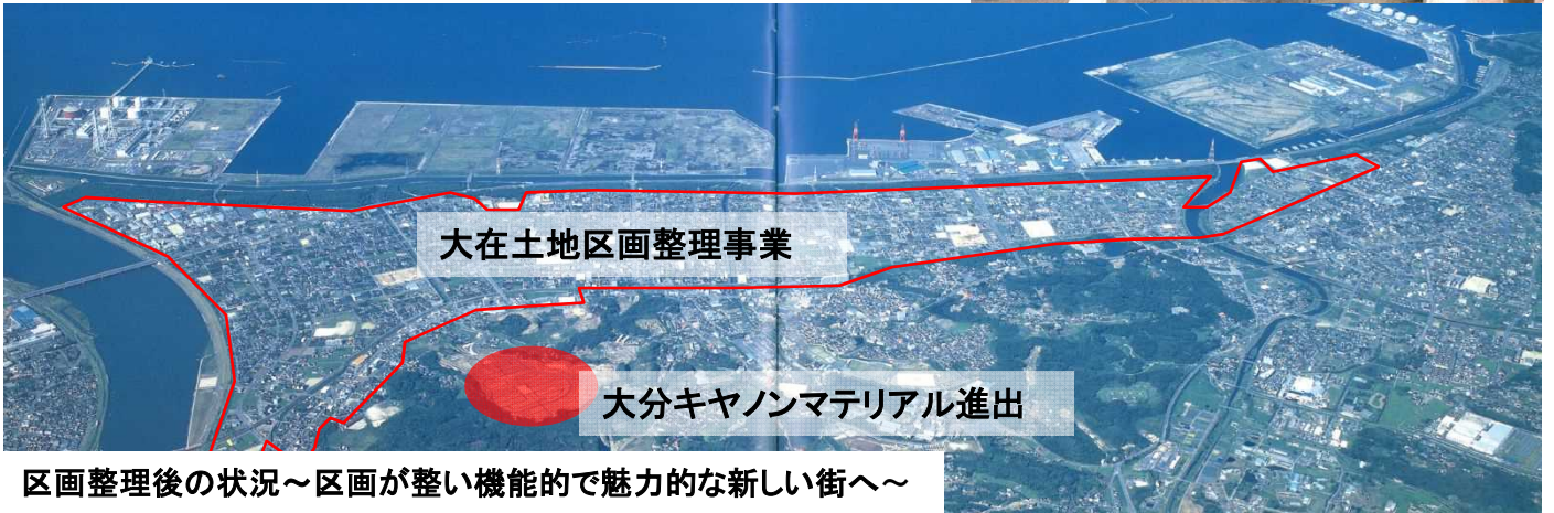
区画整理後の状況～区画が整い機能的で魅力的な新しい街へ～