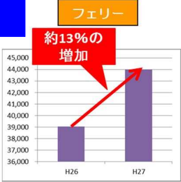
・関西や四国等へ向かう県内フェリー7航路の県内上陸者数が13%の増加