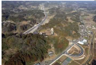
○中九州横断道路(大野～朝地間:H27.2開通)