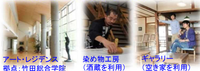
アート・レジデンス 拠点：竹田総合学院