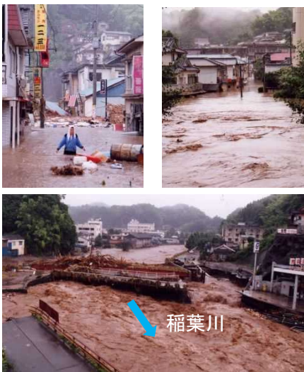
■平成2年水害 稲葉川の氾濫により甚大な被害が発生