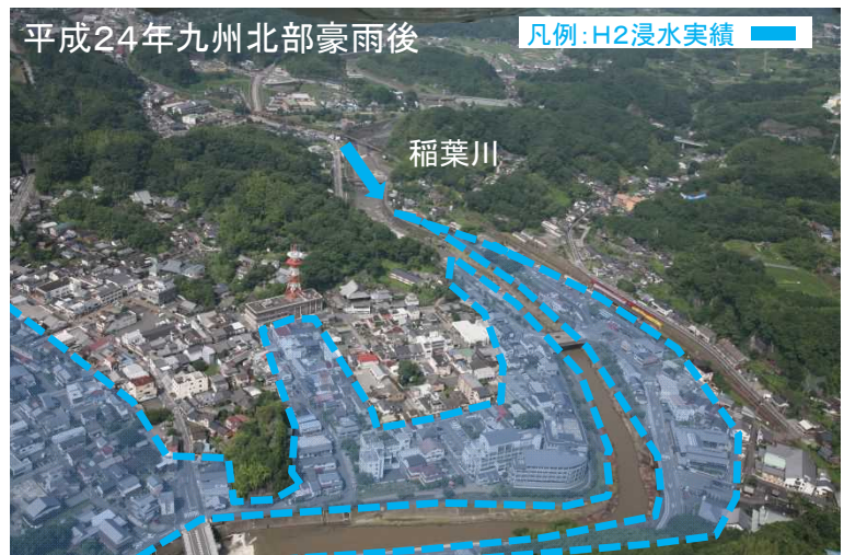
■浸水被害は発生せず、安心して暮らせる住環境を確保

稲葉ダムが完成し 安心して暮らせる住環境が整った。 さらに地域活性化の取組みを進め 移住者の積極的な受入れが可能に！