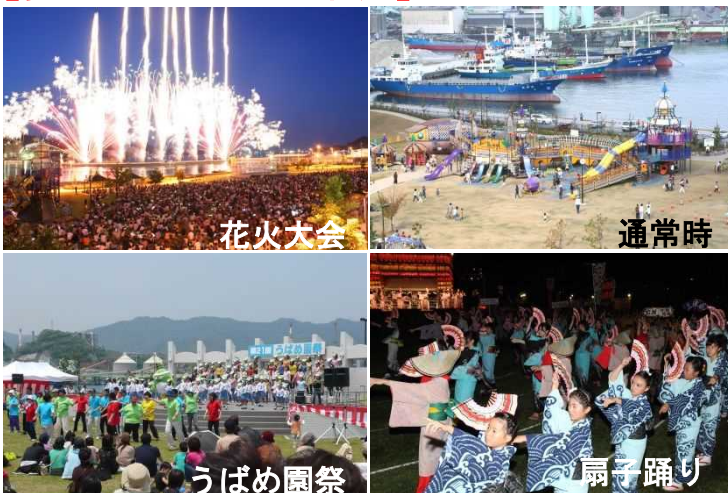
港湾緑地(つくみん公園)の集客数