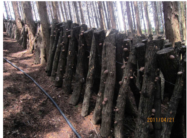
【散水(落差式)実施し収穫中 4/21 山香標高250m】

前々号、前号でも触せていただいたところですが、雨が降っていません。(湯布院も同様です。)散水可能であれば散水を。 また、仮伏せを長めにとれるところは、長めに。