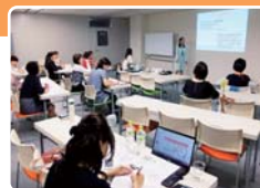
昨年度の創業実績の約4分の1は女性起業家!!

一般・若者・女性を対象にしたセミナーを県内各地で開催したほか、創業の基礎知識について学ぶ「ロングランセミナー」を毎週火曜日に行いました。今年のロングランセミナーは、約1年にわたって40回実施する予定です。