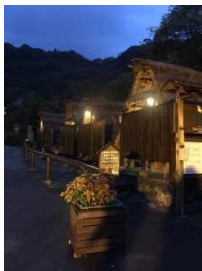
家庭泡汤的小屋子

葫芦温泉的瀑布浴号称规模日本第一。在温泉县大分宣传动画“水上芭蕉”中出场的瀑布浴据说就是借景于葫芦温泉。温泉水从高处打下来直击肩膀或腰部，感觉对肩膀酸痛有很好的疗养效果。