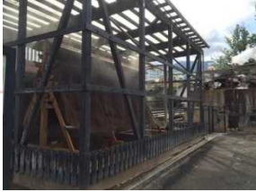
温泉冷却装置“竹汤雨”