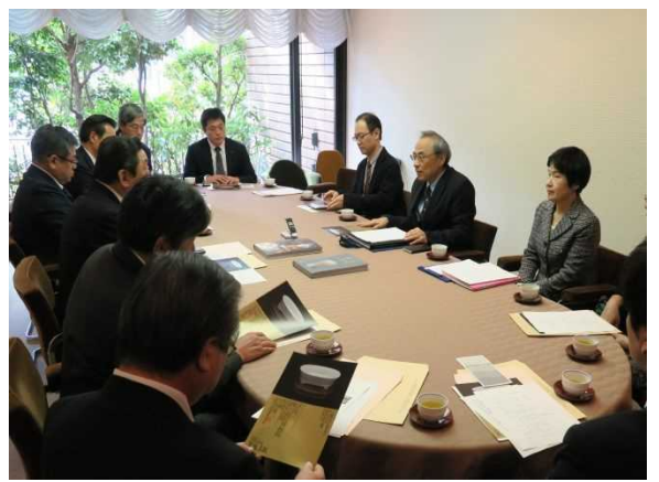
平成29年1月25日（水） 大阪市立東洋陶磁美術館 ○国立故宮博物院との交流について調査