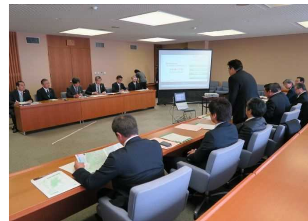
平成29年1月24日（火） 長野県観光機構 ○台湾からの訪日教育旅行について調査