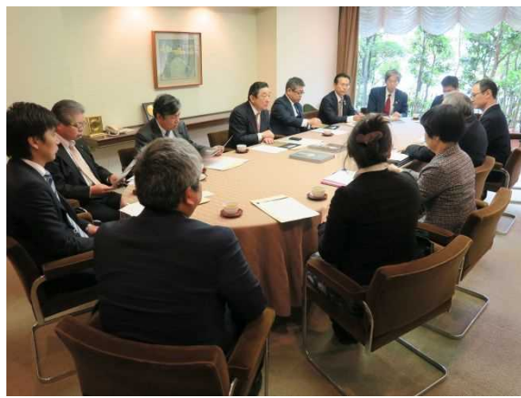
平成29年1月24日（火） 東京富士美術館 ○海外美術館との交流について調査