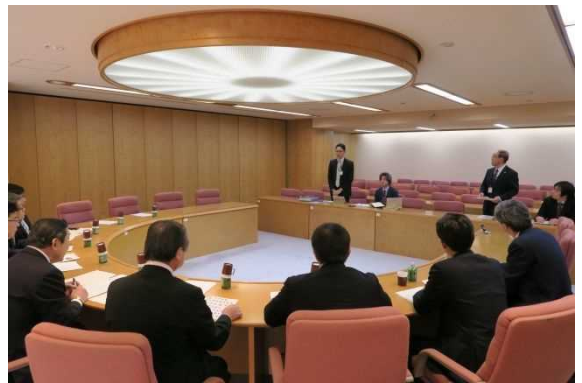
平成29年1月23日（月） 神奈川県庁 ○行財政改革とスマート県庁の取組を調査