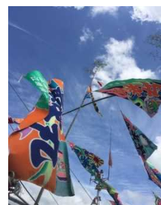
海上パレードの漁船から撮った写真

やっぱり夏は祭りと花火です！日本人の友人に連れられ、日出町の「城下カレイ祭」に出ました。友人のおかげで、日出漁港で漁船に乗って海上パレードをしたり、昔の金鉾山主が建てた立派なお屋敷で和菓子と抹茶を食べたり飲んだり、またスタンプを収集しガラポン抽選会に参加したりと、楽しい週末を過ごしました。海辺ではじめて生きたカレイと烏賊などを見て、今までずっと内陸に暮らしていた私にとって面白いと思いました。7月に家族が来ますので、また一緒に「面白い」大分を発見しようと思います。