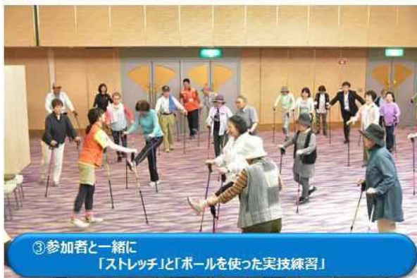
③ 参加者と一緒に「ストレッチ」と「ポールを使った実技練習」