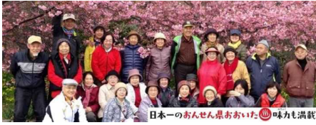
日本一のおんせん県おおいた 味力も満載