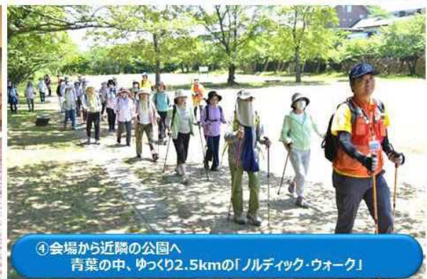
④ 会場から近隣の公園へ青葉の中、ゆっくり2.5kmの「ノルディック・ウォーク」