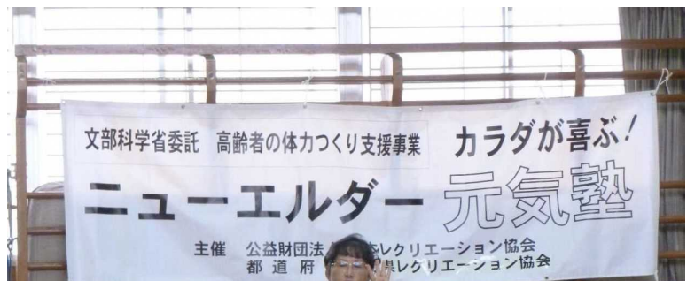
ニューエルダ一元気塾 in 竹田 (平成28年10月～12月)