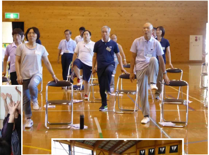
サロン支援者のためのリーダー講習会 (平成29年7月～9月)