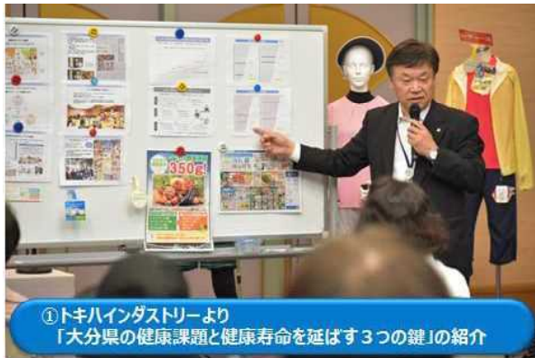
① トキハインダストリーより「大分県の健康課題と健康寿命を延ばす3つの鍵」の紹介