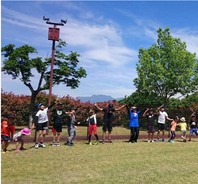
「あそびの日」全国一斉キャンペーン (平成29年5月～6月)