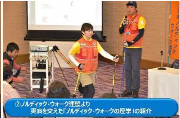
② ノルディック・ウォーク連盟より実演を交えた「ノルディック・ウォークの座学」の紹介